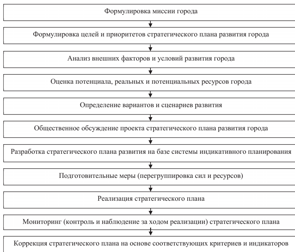
Рис. 3. Основные этапы стратегического планирования развития крупных городов